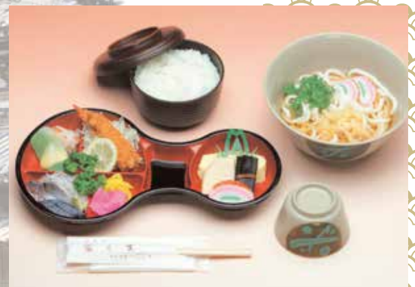
南大門 1,131円 (本体価格1,048円+消費税83円)