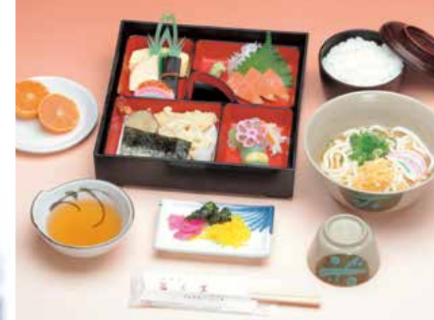
法隆寺 1,543円 (本体価格1,429円+消費税114円)