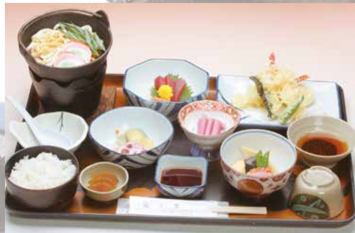
夢殿(ゆめどの) 2,160円 (本体価格2,000円+消費税160円)