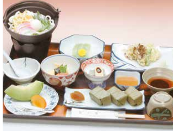
斑鳩(いかるが) 2,160円 (本体価格2,000円+消費税160円)