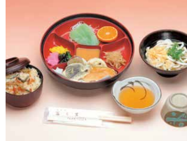
いなかめし 1,131円 (本体価格1,048円+消費税83円)