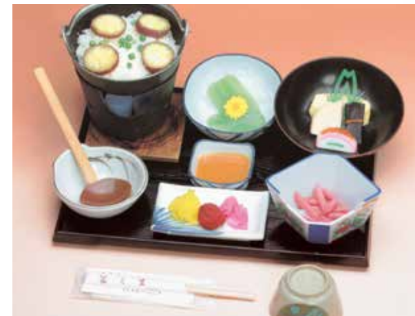
いもがゆ膳 1,543円 (本体価格1,429円+消費税114円)