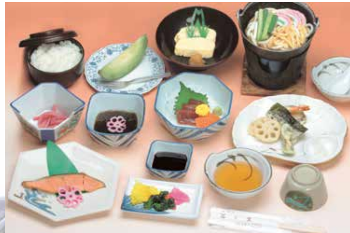
大和路 2,776円 (本体価格2,571円+消費税205円)