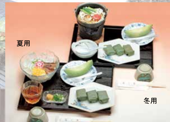
柿の里 1,131円 (本体価格1,048円+消費税83円)